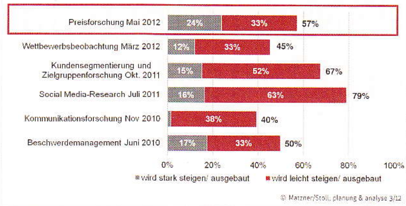
Abbildung 2: Zukünftige Entwicklung von Marktforschungsthemen aus Nachfragesicht (Angaben in %)

Conjoint-Verfahren nehmen unter den verwendeten Methoden eine wichtige Rolle bei Preisfindungsprojekten ein. Ebenfalls gebräuchlich ist die Van-Westendorp-Methode. Aber auch qualitative Verfahren kommen zum Einsatz. Mehrheitlich werden dabei die Meinungen von Privatkunden erhoben und analysiert. In der Preisfindung kommt allerdings auch den Preiseinschätzungen von B2B-Endkunden und -Absatzmittlern eine bedeutsame Rolle zu. ◀